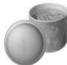
骨壺に水が溜まっている様子